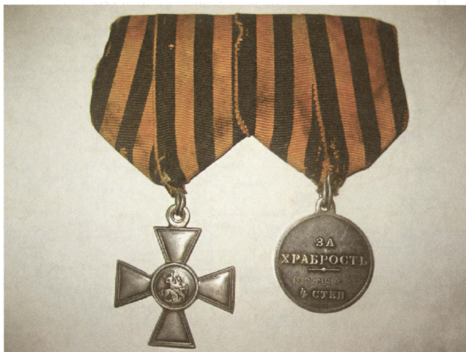
Георгиевский крест и медаль «За храбрость».

Родился будущий партизан в селе Котельва на Полтавщине в бедной многодетной крестьянской семье. С раннего детства много работал. Как и многие знаменитые партизаны, проявил себя ещё во время Первой мировой войны, участвовал в знаменитом Брусиловском прорыве, когда русская армия под командованием генерала Алексея Алексеевича Бру-