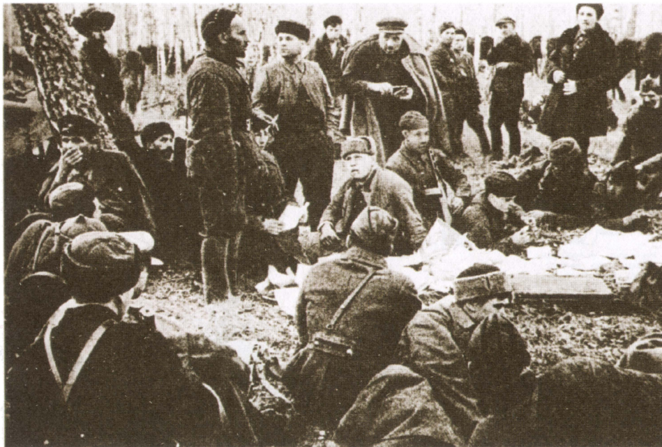
С.А. Ковпак выступает перед партизанами.