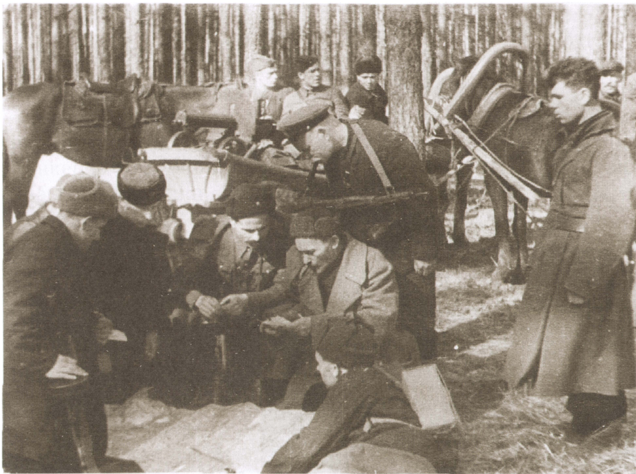
Штаб бригады С.А. Ковпака.

армиям под Сталинградом, Сидор Ковпак провёл операцию «Сарненский крест». Было взорвано около десяти железнодорожных мостов вокруг Сарненского железнодорожного узла в Украине. Фашистские группы армий «Центр» и «Юг» не дождались многих нужных им воинских частей, техники и боеприпасов. Взбешённые фашисты бросили против Ковпака большие силы карателей. С тяжёлыми боями ковпаковцы вынуждены были отойти на территорию Беларуси. В деревне Гулевичи Житковичского района Сидор Ковпак встретился с прославленным командиром пинских партизан Василием Захаровичем Коржом.