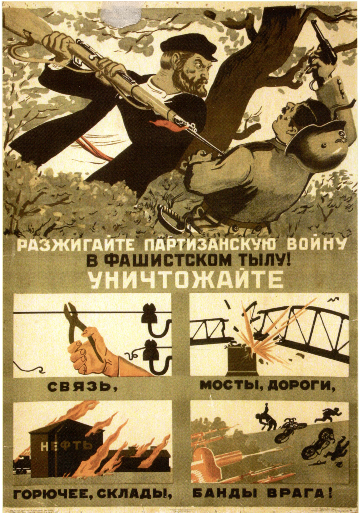
Плакат 1941 года.