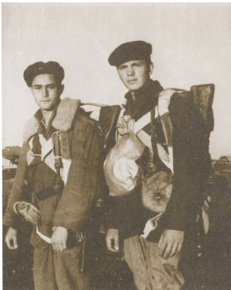
Партизаны-подрывники перед выходом на задание.