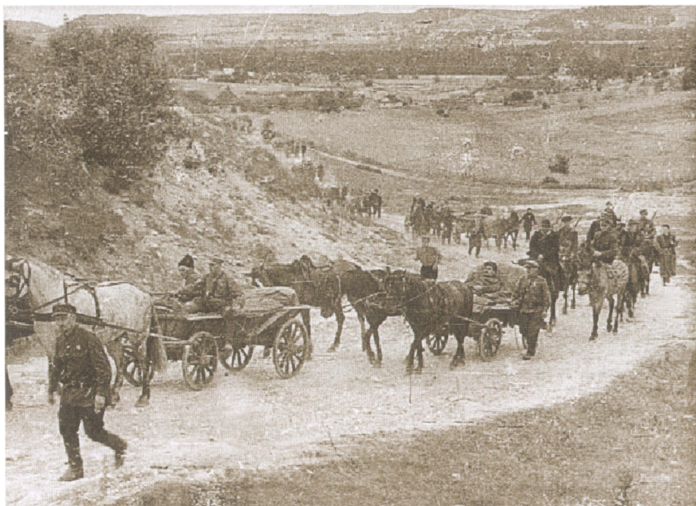
Партизанское соединение на марше.

Осенью 1942 года Ковпак с присоединившимся к нему партизанским отрядом Александра Николаевича Сабурова направился к белорусскому районному центру Лоеву. Гитлеровцы в страхе разбежались, так и не решившись вступить