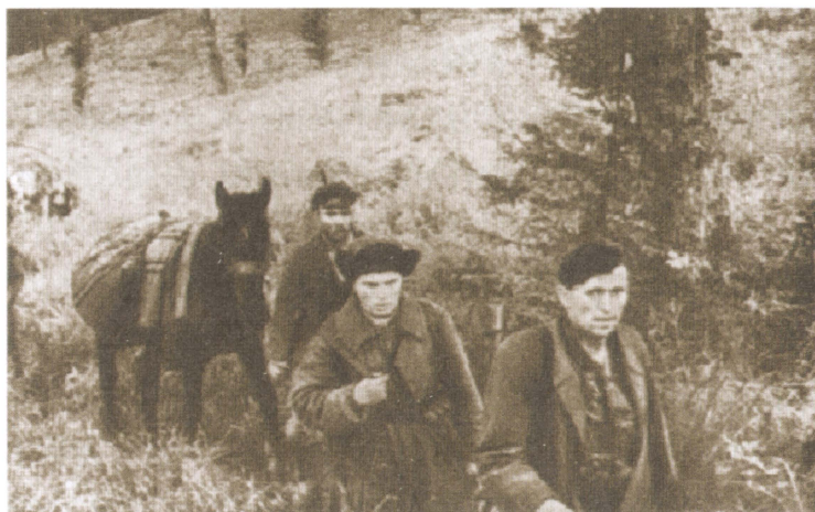
Партизаны в дозоре.