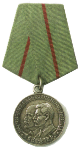
Медаль «Партизану Великой Отечественной войны» I степени.

шистских состава с машинами, самоходками, боеприпасами. Партизаны Ковпака освободили городской посёлок Мир, где находится знаменитый Мирский замок.