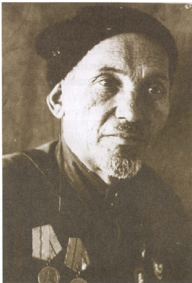
Командир партизанского соединения Сидор Артемьевич Ковпак.

Фашисты в декабре 1942 года рвались к Волге — в разгаре была судьбоносная Сталинградская битва. Чтобы не дать врагу беспрепятственно направлять подкрепления своим