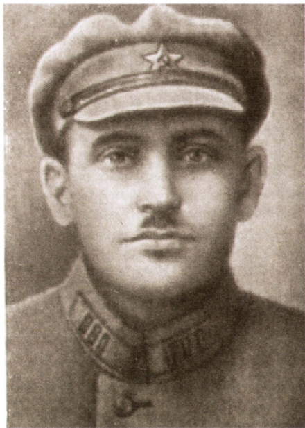
С.А. Ковпак в Красной Армии в годы Гражданской войны.