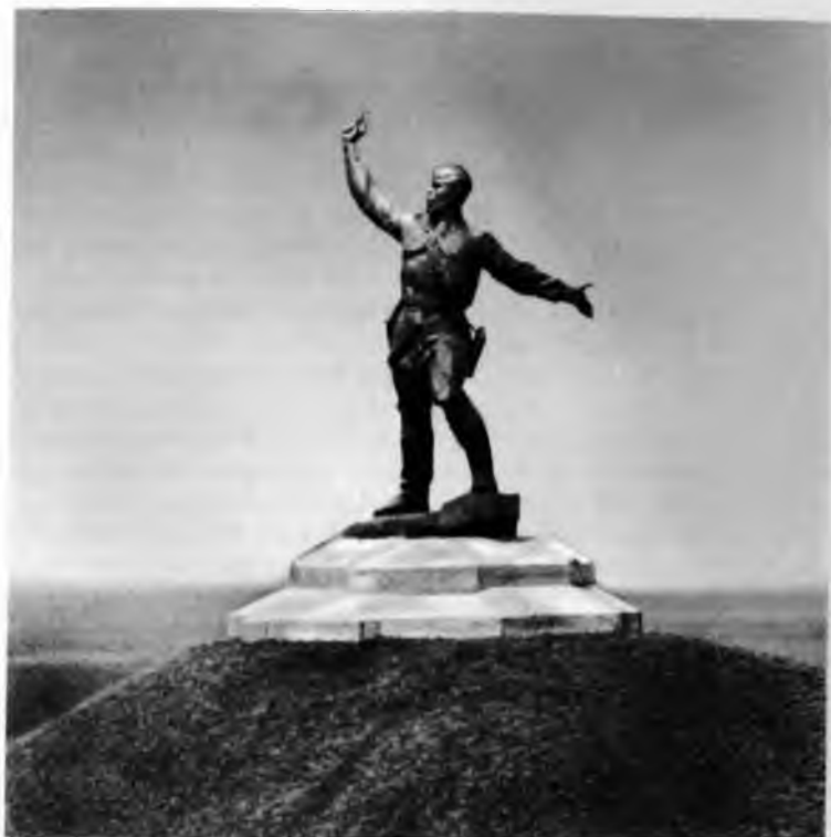
Комиссарово поле. Памятник политработникам Великой Отечественной.

Многое сделал молодой председатель для того, чтобы вывести первый на запорожской земле колхоз в передовые, добиться высоких урожаев, стать участником Всесоюзной сельскохозяйственной выставки в Москве — этой чести возглавляемое им хозяйство удостоивалось дважды.