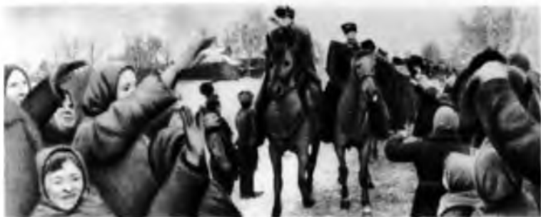
Население отбитой у фашистов деревни Р. восторженно встречает гвардейцев-кавалеристов.