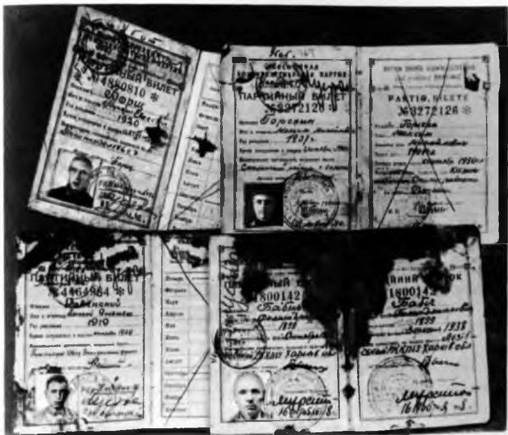
Партийные билеты коммунистов, погибших в боях.