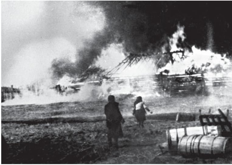
Вид подожженного села в Бегомльском районе. 1941 г.