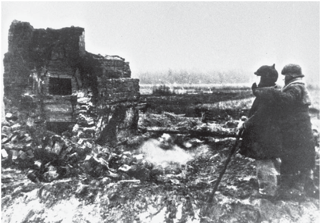
Жители д. Кончаны Городокского района Степан и Коля на пепелище родного дома. [1941–1944 гг.].