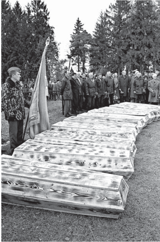
Во время митинга на кладбище в г. Сенно при перезахоронении 189 воинов и мирных жителей, погибших во время Великой Отечественной войны на территории района. Ноябрь 1999 г.