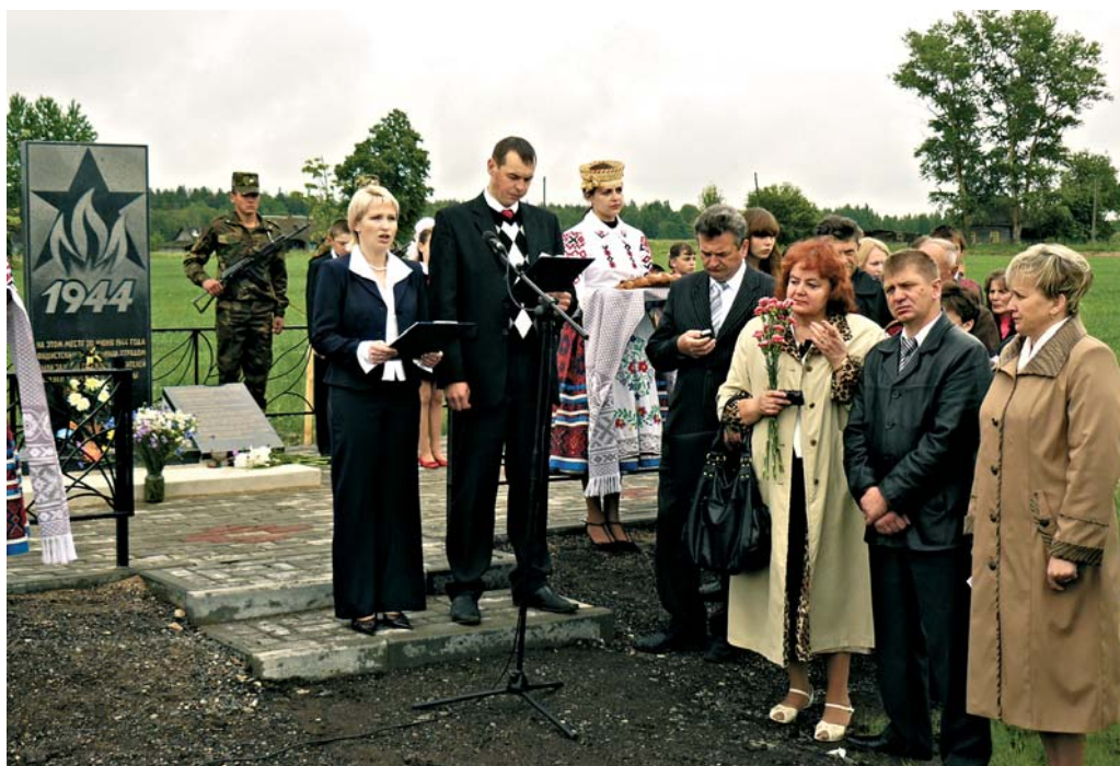
Во время открытия памятника сожженным в годы Великой Отечественной войны деревням Веретеи, Толщи, Чупры в Докшицком районе. 20 июня 2009 г.