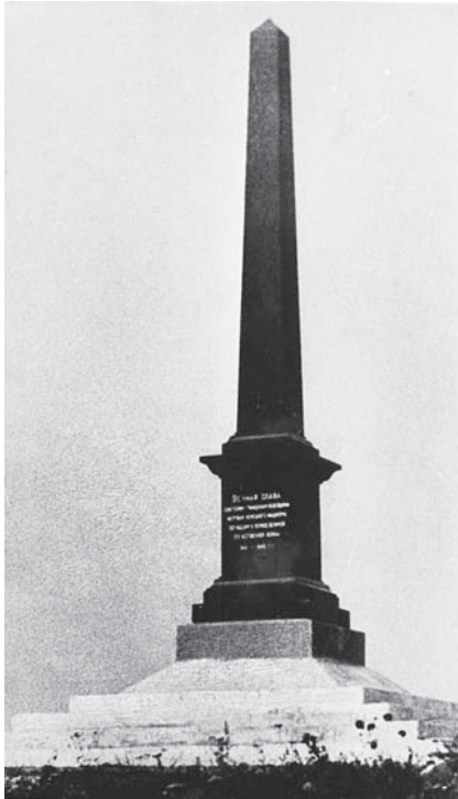
Обелиск в память жертв фашистского террора в г.п. Освея. 1969 г.