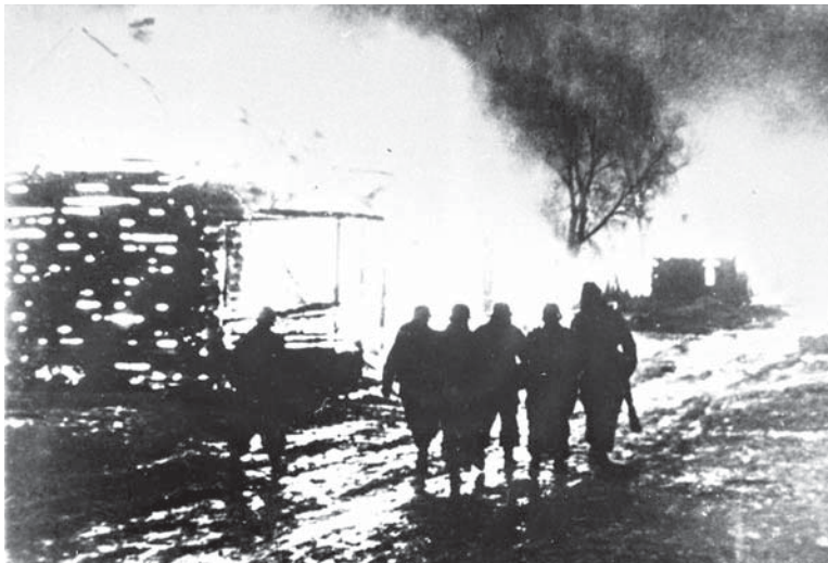
Немецкие оккупанты в подожженной деревне Ушачского района. 1943 г.