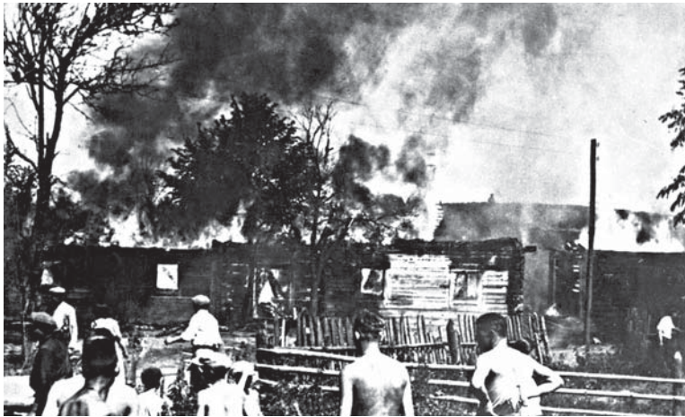
Поджог домов немецкими оккупантами, г. Витебск.