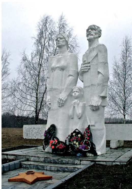
Монумент в честь жителей населенных пунктов Чашниковского района, подвергшихся уничтожению в годы Великой Отечественной войны, в мемориальном комплексе «Вишенки», д. Вишенки Чашниковского района. 20 марта 2008 г.