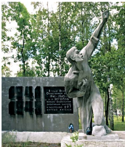
Вид на памятник, установленный в г.п. Бегомль на месте расстрела мирных жителей в годы Великой Отечественной войны. 2005 г. БГАКФФД.