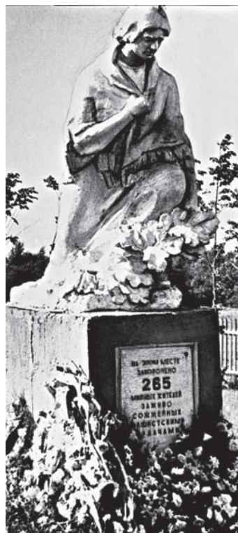
Памятник на месте захоронения мирных граждан в д. Володарка Городокского района. 1969 г.