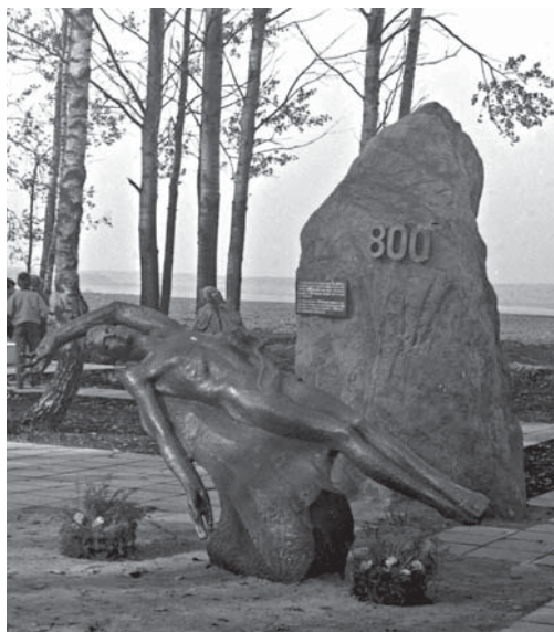
Мемориал жертвам фашизма в урочище «Ходоровка» Докшицкого района. 1992 г. БГАКФФД.