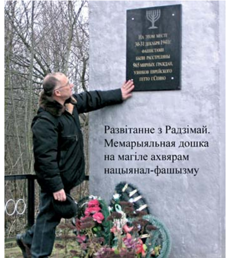
Развітанне з Радзімай. Мемарыяльная дошка на магіле ахвярам нацыянал-фашызму