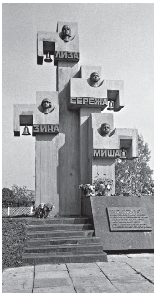
Памятник детям бывшего командира 1-й Белорусской партизанской бригады М.Ф. Шмырева в г.п. Сураж. 1984 г.