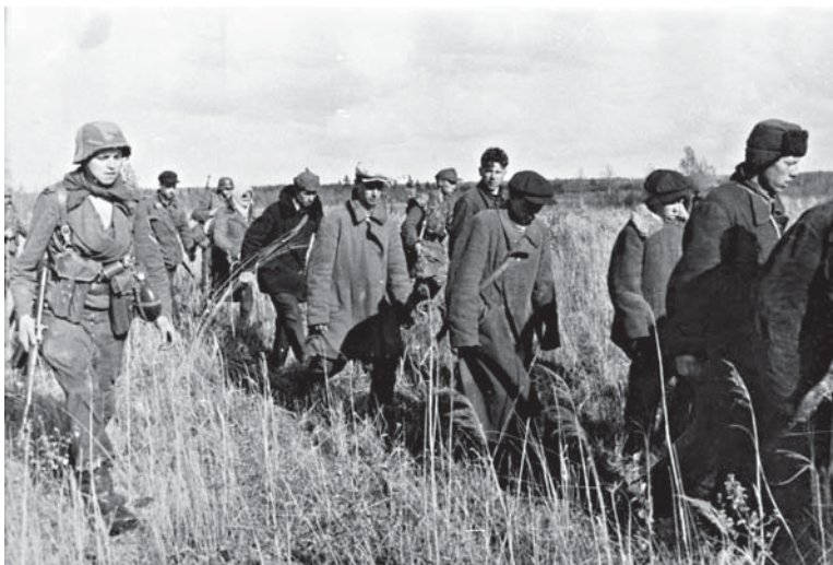
Задержанные во время немецкой облавы жители деревень Витебской области. Май 1944 г. БГАКФФД.