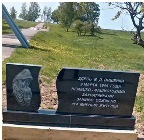
Памятник жителям сожженной д. Вишенки.