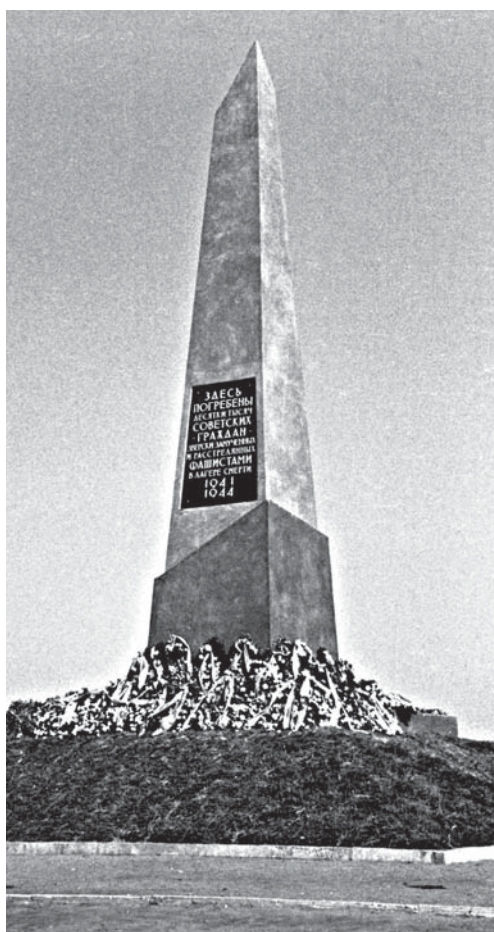
Памятник советским гражданам, погибшим в лагере смерти «5-й полк» в г. Витебске. 1964 г. БГАКФФД.