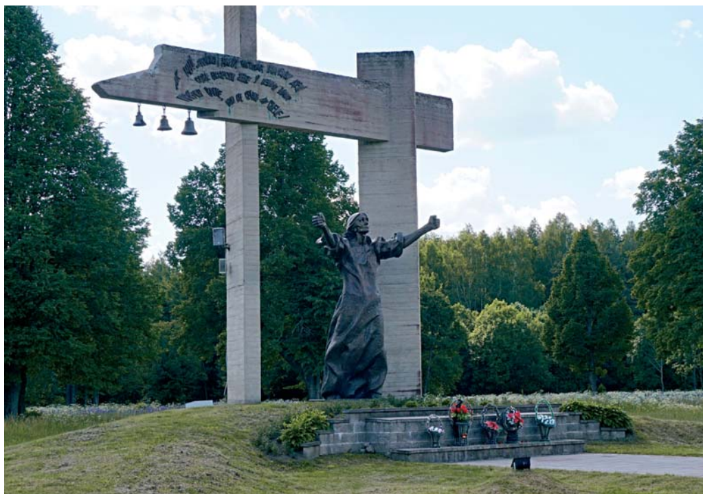
Мемориальный комплекс «Проклятие фашизму» на месте сожженной д. Шуневка Докшицкого района.