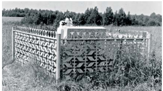
Памятник жителям сожженной д. Цигельники.