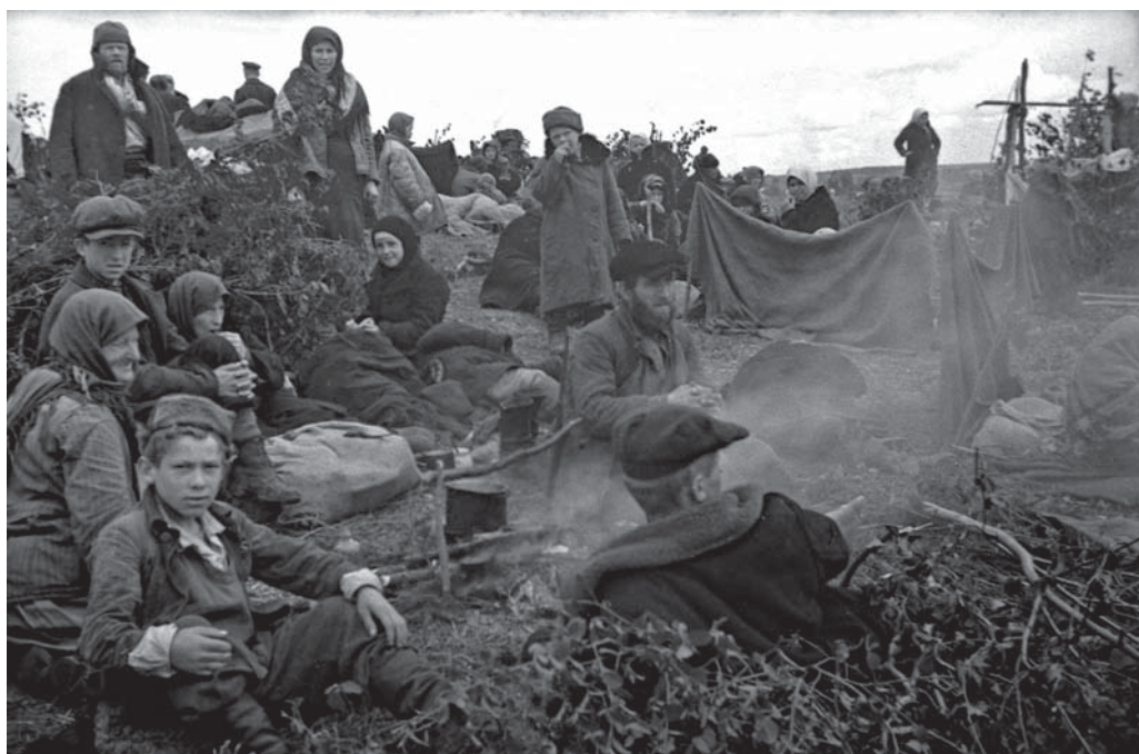
Узники одного из фашистских концлагерей под открытым небом, освобожденные в ходе наступательных действий 5-й Гвардейской танковой армии 3-го Белорусского фронта. 1944 г.