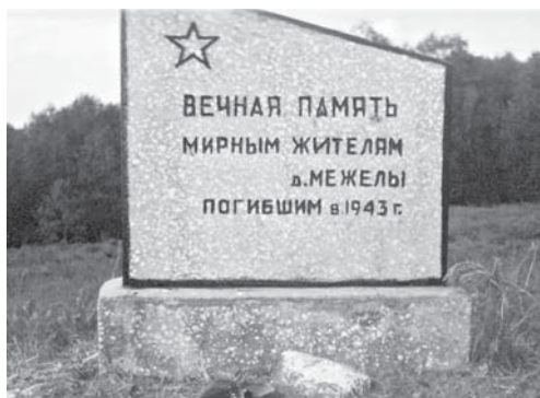
Памятник жителям сожженной д. Межелы.