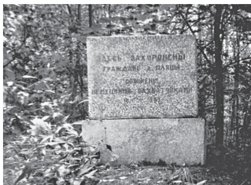
Памятник жителям сожженной д. Пляцы.