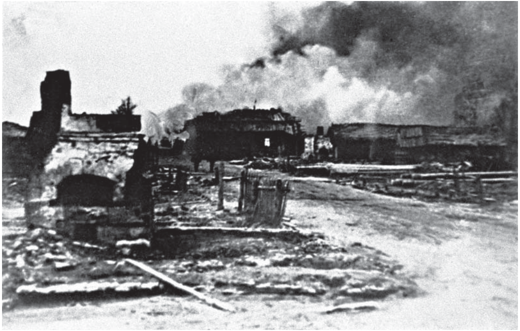
Село в Оршанском районе, подожженное немецкими оккупантами. 1944 г. БГАКФФД.