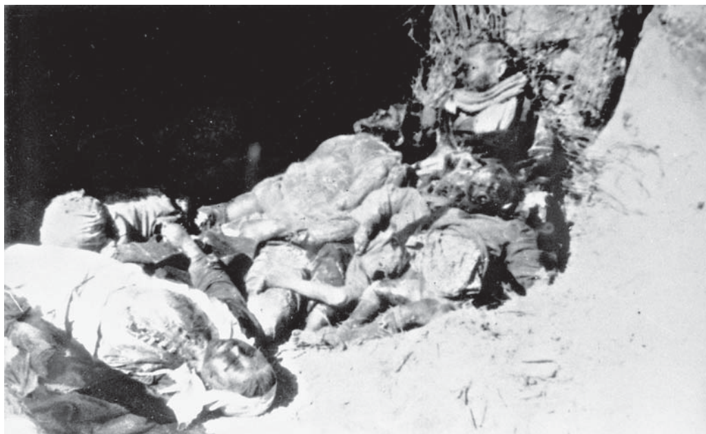
Тела расстрелянных оккупантами мирных граждан в Бегомльском районе. 1944 г. БГАКФФД.