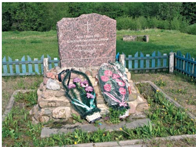
Памятник жителям д. Дубиково Городокского района, расстрелянным в 1943 г. немецкими оккупантами. 14 мая 2008 г. БГАКФФД.