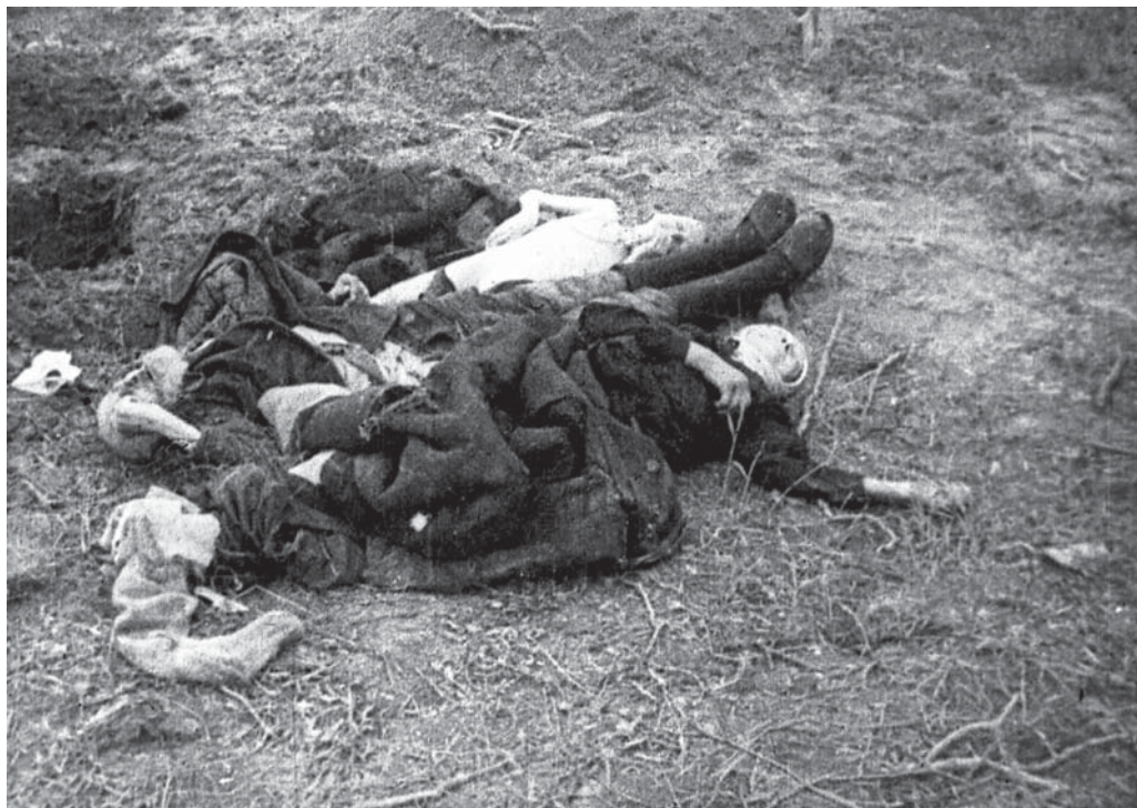
Трупы советских людей, замученных немецкими оккупантами в концлагере под г. Витебском. 1944 г. БГАКФФД.