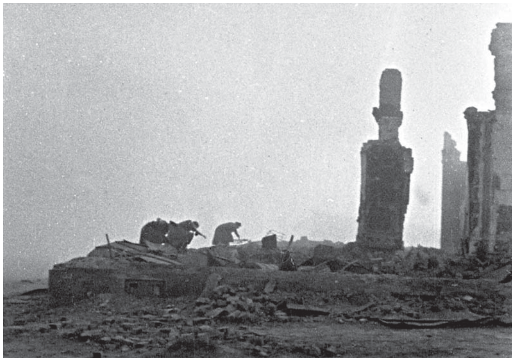
Вид на сожженные дома в г.п. Ляды. 1943 г.