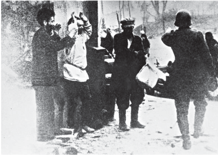
Немецкие солдаты арестовывают мирных жителей г. Витебска. 1941 г.