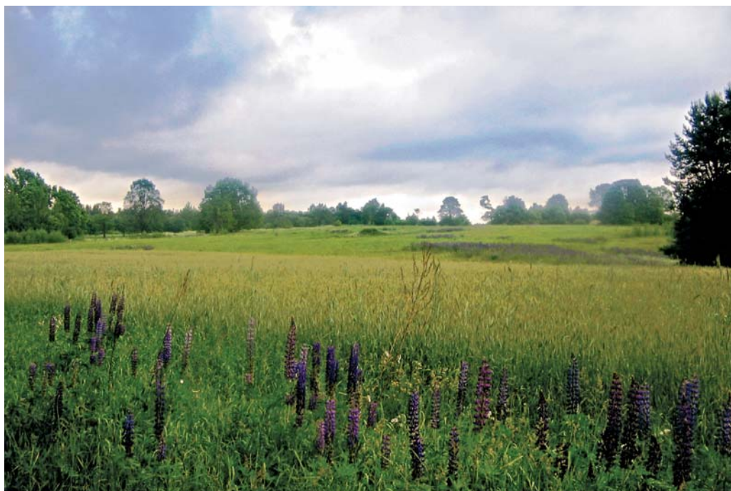
Здесь находилась д. Залещино.