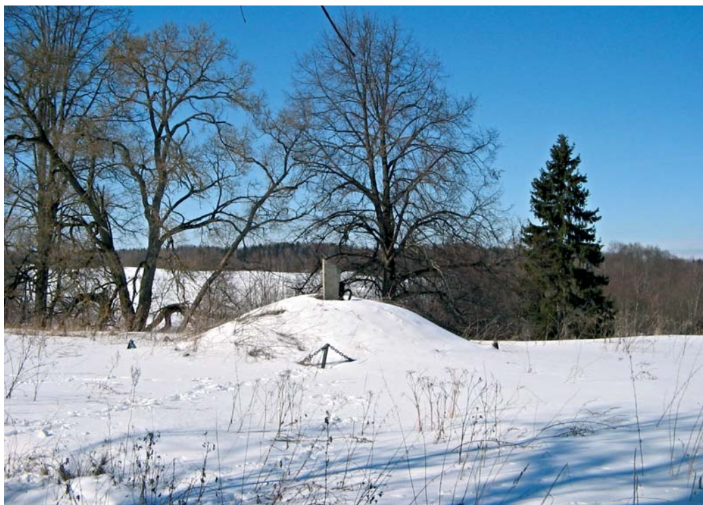
Памятник жителям сожженной д. Корзуны.