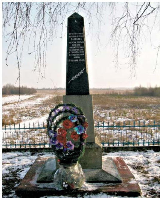
Памятник жителям сожженной д. Слободка.