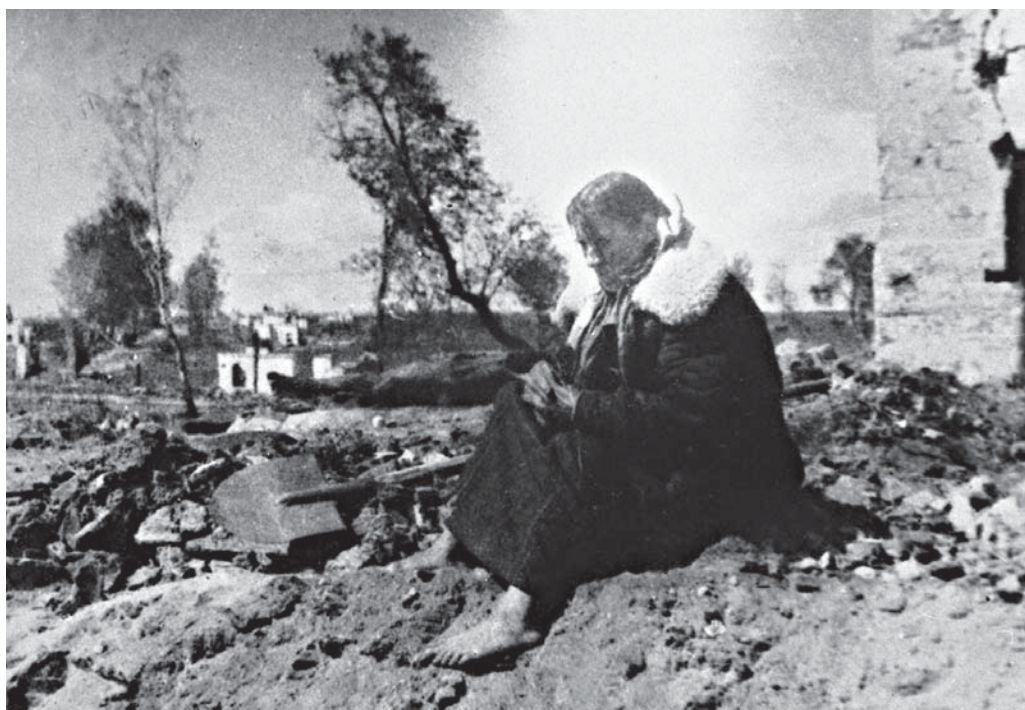
После налета фашистской авиации на д. Витуничи Бегомльского района. 1943 г. БГАКФФД.