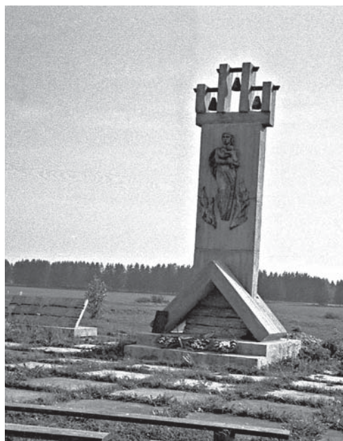
Памятник жителям д. Асташево, сожженным немецкими захватчиками. 1982 г. БГАКФФД.