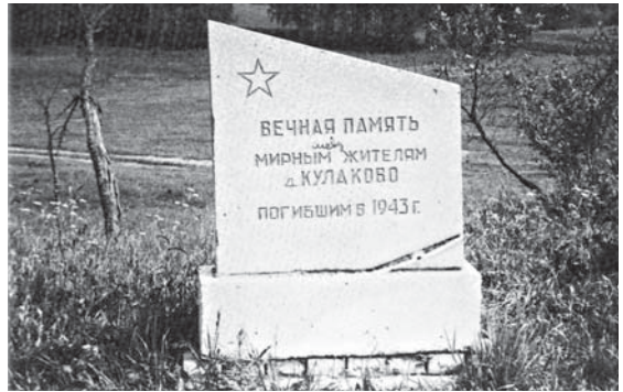
Памятник жителям сожженной д. Кулаково.