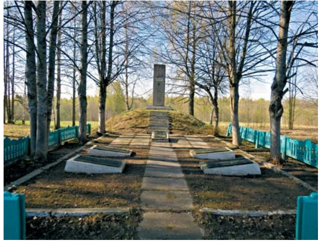
Памятник сожженной д. Велье.