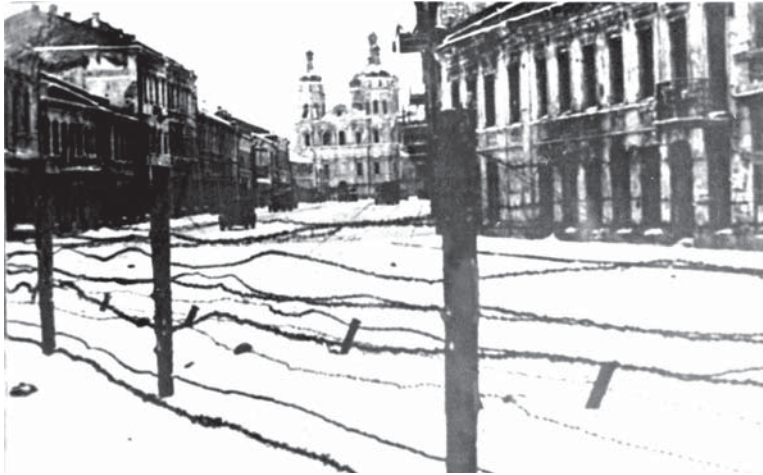
Вид проволочных заграждений на ул. Замковой в г. Витебске. Декабрь 1943 г. БГАКФФД.