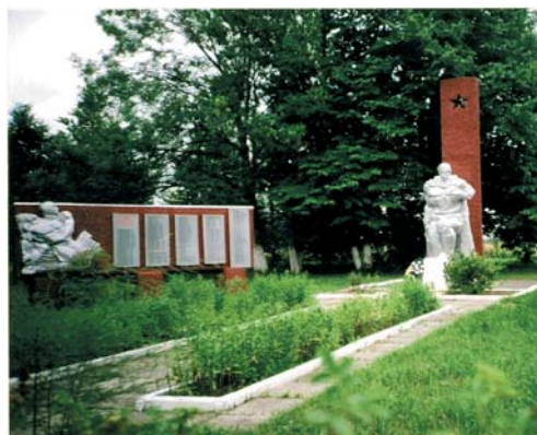
Памятник на братской могиле советских воинов и мирных жителей в д. Лонские. Похоронены жители д. Куштали, Трабовщина и других деревень и хуторов Иудского сельсовета.