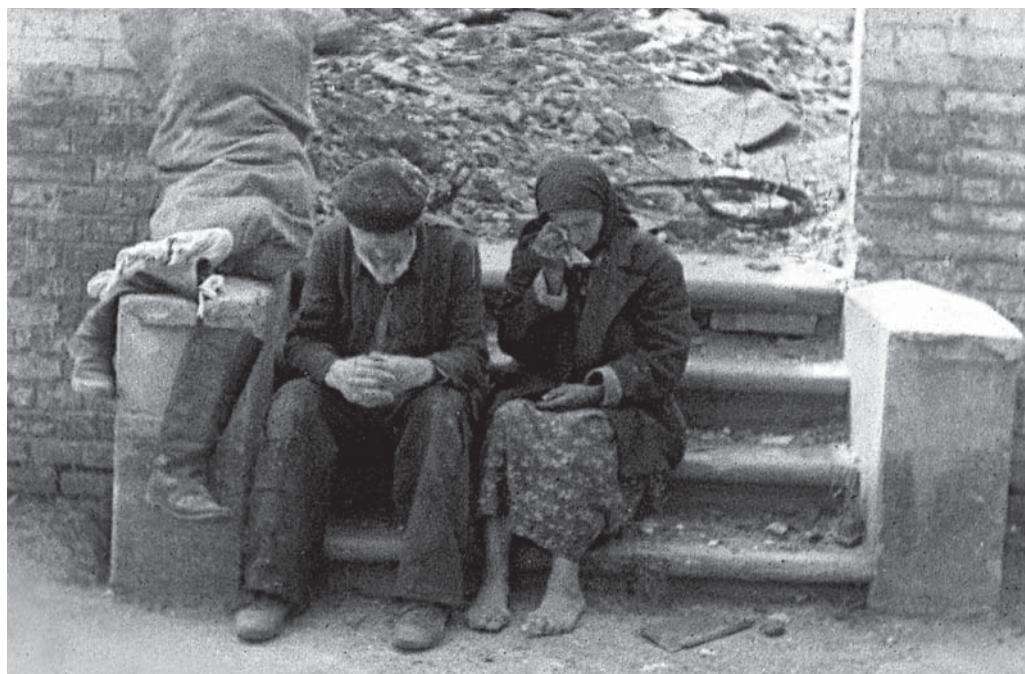
Жители одного из населенных пунктов Оршанского района, оставшиеся без крова в годы Великой Отечественной войны. 1944 г.