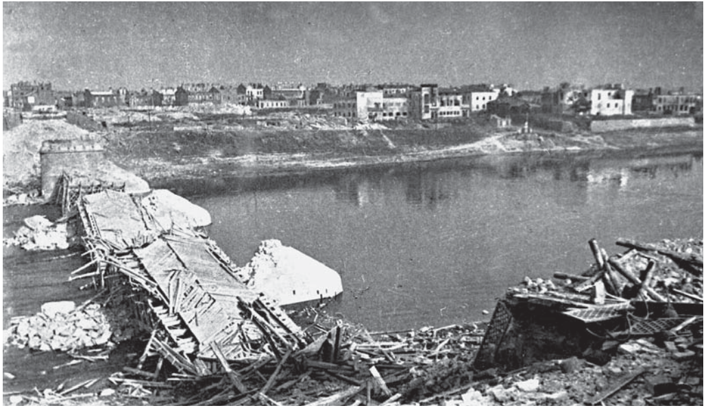
Вид на разрушенный г. Витебск после освобождения от немецко-фашистских захватчиков. Июль 1944 г.