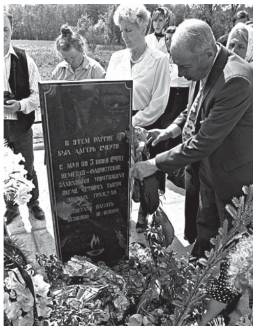
У мемориального знака памяти узников лагеря смерти близ д. Марьяново в день его открытия. Июнь 1998 г.