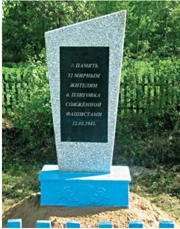
Памятник жителям сожженной д. Плиговки.