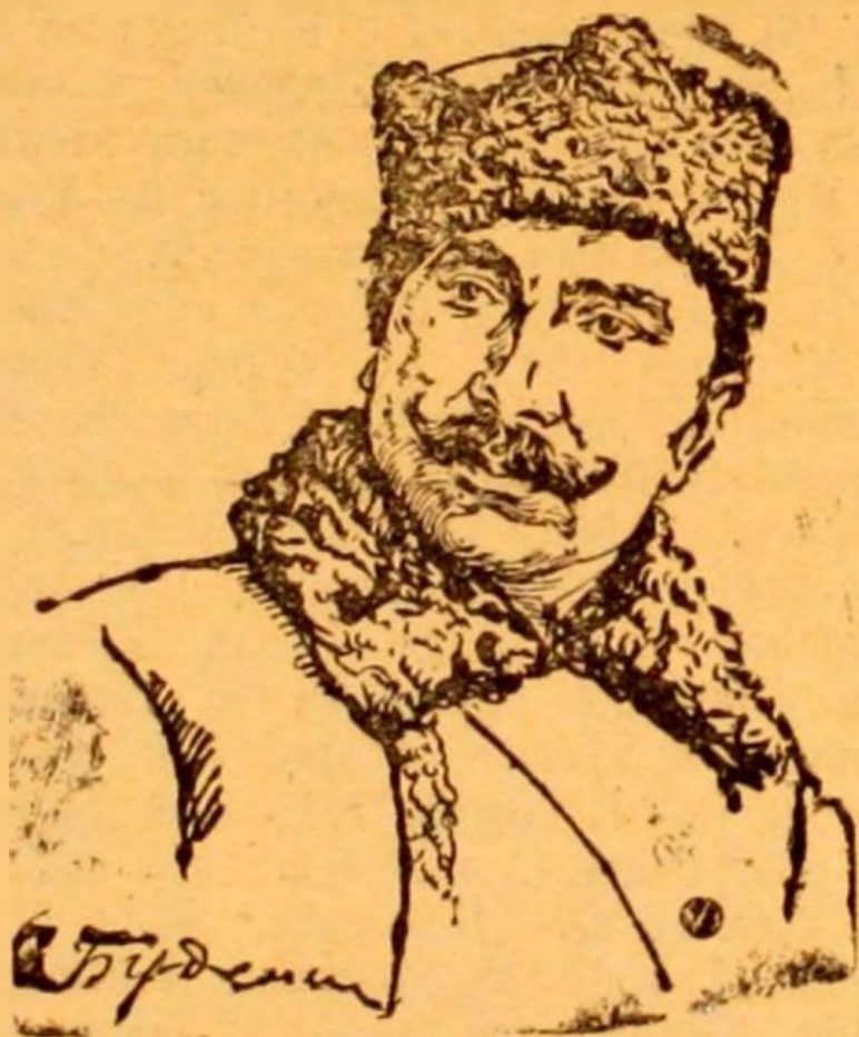
Инспектор кавалерии РККА тов. Буденный.

ленник мировой контр-революции барон Врангель, что потребовало срочной переброски сил. Все эти причины вынудили Красную Армию прекратить наступление и начать отход. После ряда боев польские паны поняли безнадежность дальнейшей борьбы и вынуждены были подписать с нами мир. И июне 1920 года начинается наступление Врангеля. Ему удалось продвинуться на Украину и создать угрозу Донбассу и тылу Красных частей, действующих на польском фронте. Подоспевшими Красными частями, снятыми с западного фронта после