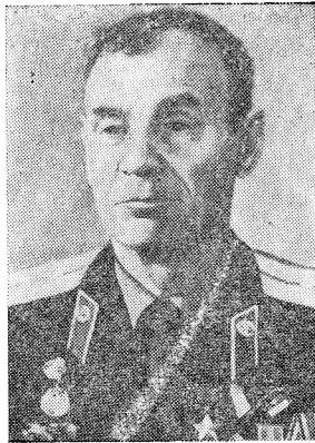
И. Е. ГРИБ, Герой Советского Союза