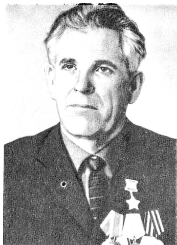
Д. И. ЛЕВИЦКИЙ