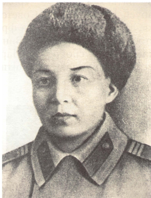
| Маншук Маметова.