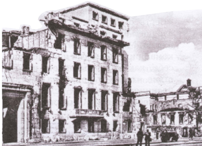
| Разрушенное здание рейхсканцелярии.