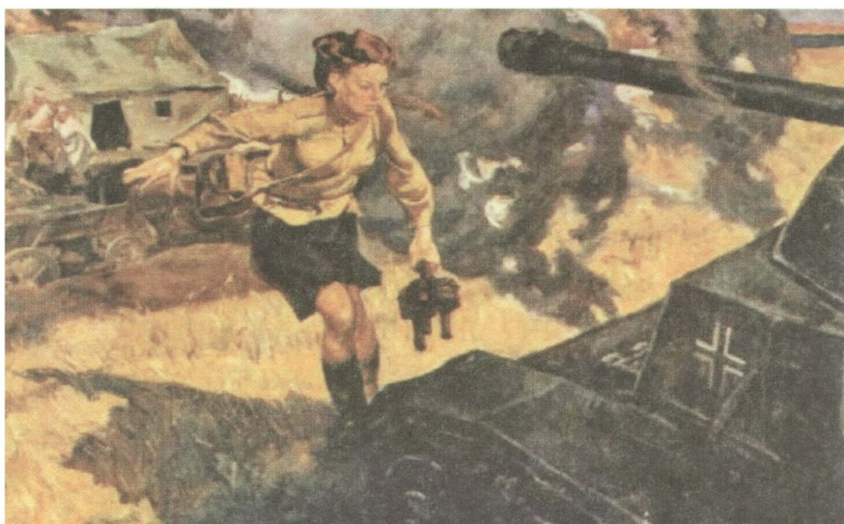
| Подвиг санинструктора Валерии Гнаровской.