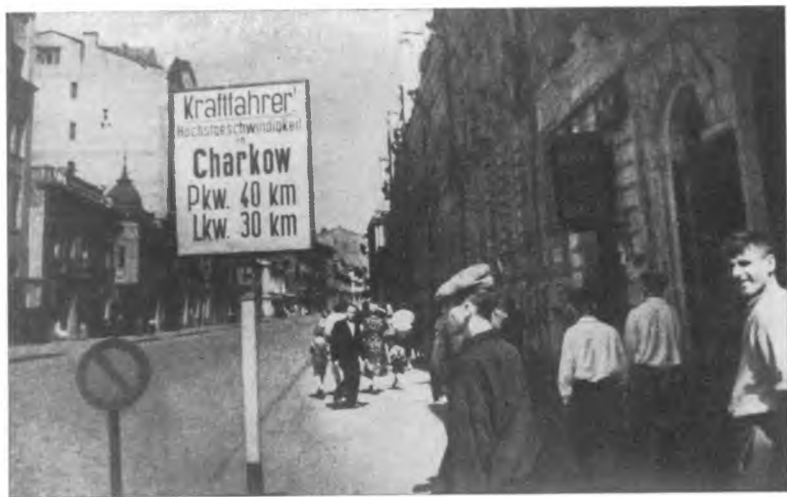
Первые дни после освобождения.