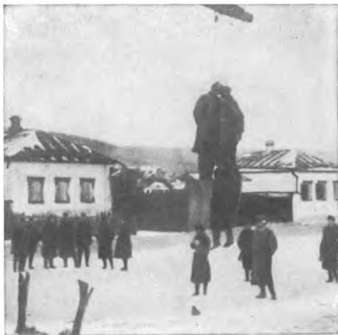
Так начинался фашистский террор.