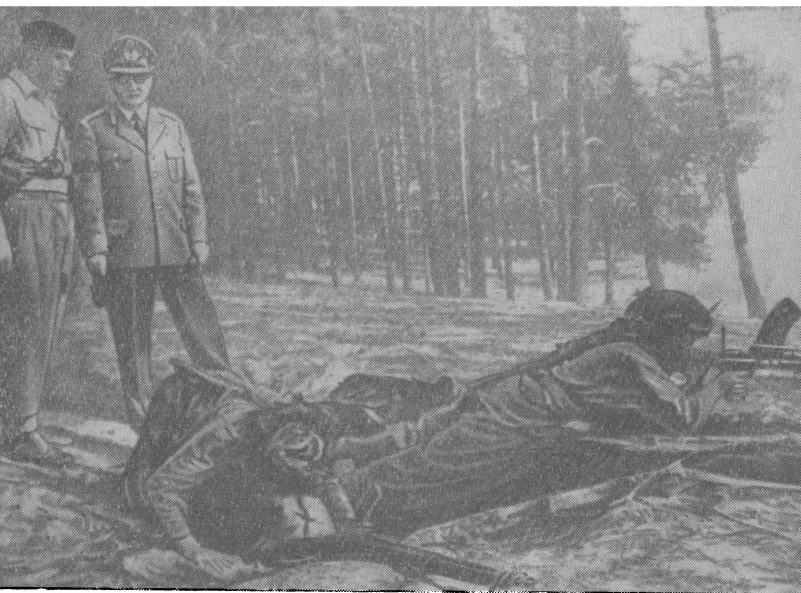
Шпейдель инспектирует пушечное мясо

Этому человеку из старой милитаристской клики германского империализма предоставили теперь право распоряжаться атомными бомбами и ракетами в сердце Европы.